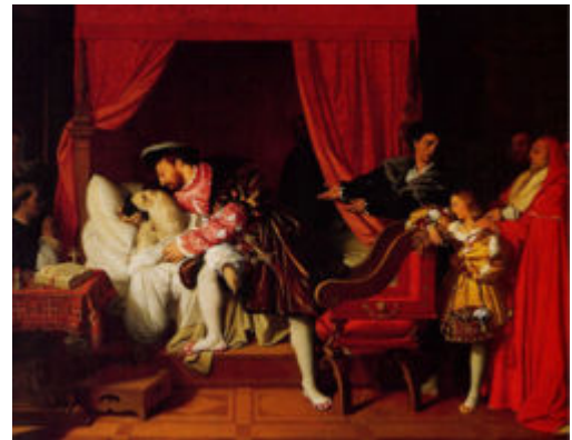
Jean Auguste Dominique Ingres, La mort de Léonard de Vinci Paris, Musée du Petit Palais

Ce délicieux « palazzo » ne vit pourtant jamais le jour, pas plus que cette monumentale cité idéale que le maître toscan échafauda à Romorantin, où il associa un palais royal sur l'eau, des écuries sophistiquées, un nouveau quartier pour loger la cour et une véritable ville neuve autour d'un complexe réseau de canaux, l'inscrivant dans une perspective de capitale pour le royaume. La motivation de François Ier était, semble-t-il, de donner à sa cour, trop à l'étroit à Amboise, et à son administration royale, logée à Tours, une résidence digne de son armée en Italie, intégrant les nouveautés architecturales d'Italie et propre à éblouir le grand rival Charles Quint.