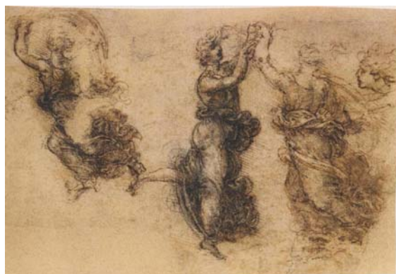
Léonard de Vinci, Jeunes filles dansant , Gallerie dell'Accademia de Venise

Pour la première fois, les derniers dessins originaux de Léonard de Vinci reviennent au Château du Clos Lucé dans le lieu même où le Maître les a esquissés cinq siècles plus tôt. Ce prêt exceptionnel des Gallerie dell'Accademia de Venise représente le temps fort de l'exposition consacrée aux relations entre Léonard de Vinci et la France.