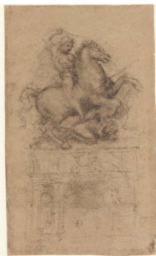
Léonard de Vinci, Etude pour un monument équestre Windsor Castle RL 12354

Cinq siècles plus tard, les derniers dessins du maître retrouvent le lieu où ils furent esquissés, entre 1516 et 1519. Pour la première fois les originaux de l'« Etude de fleurs », l'« Etude de cheval et deux figures » et les célèbres « Jeunes filles dansant » sont exposées. Exceptionnellement prêtés par les Galeries de l'Académie de Venise, ces originaux constituent l'une des pièces maîtresses de cette série des derniers dessins, riche en outre de « The Pointing Lady » et de la fameuse série du « Déluge », d'où a été tiré un film d'animation, avec la voix d'Anjelica Huston.