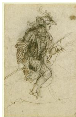
Léonard de Vinci, Cavalier costumé de profil

Le 2 mai 1519, à 67 ans, le plus grand visionnaire de la chrétienté venait de rejoindre celui qu'il appelait : « l'opérateur de tant de choses merveilleuses ». N'avait-il pas écrit que « ne pas estimer la vie, toute la vie, c'est ne pas la mériter ».